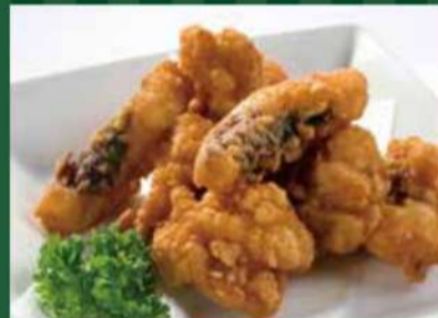
タコの唐揚げ 460円 (税込 506円)