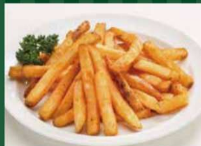
スパイシーポテト 480円 (税込 528円)