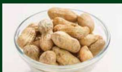
塩ゆで落花生 290円 (税込 319円)