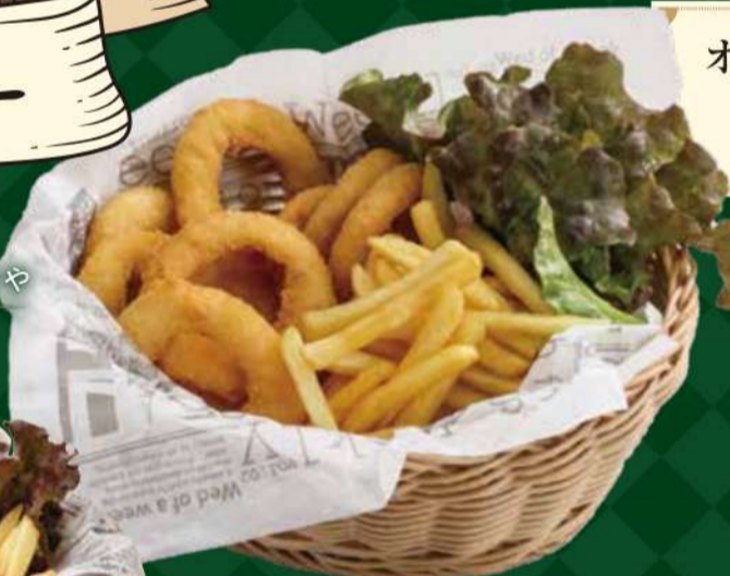
ナゲット&ポテト 770円 (税込 847円)