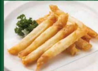
チーズスティック 470円 (税込 517円)