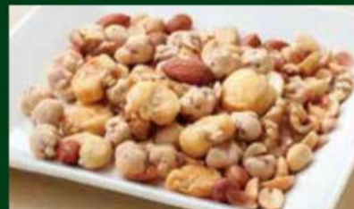
ミックスナッツ 290円 (税込 319円)