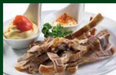
あたりめ 250円 (税込 275円)