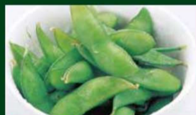
枝豆 270円 (税込 297円)