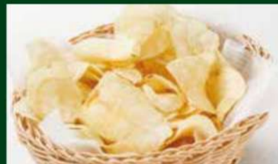
ポテトチップス 290円 (税込 319円)