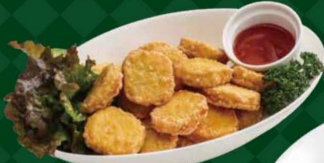
山盛りチキンナゲット