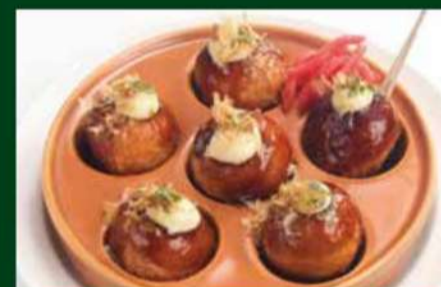
たこ焼き 470円 (税込 517円)