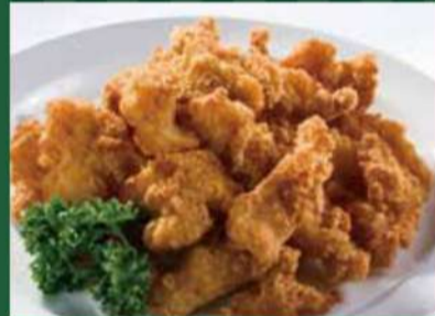
ヤゲン軟骨の唐揚げ 460円 (税込 506円)