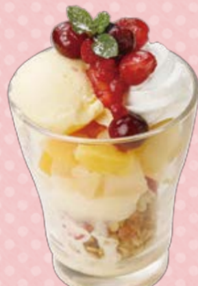
ミニベリーパフェ