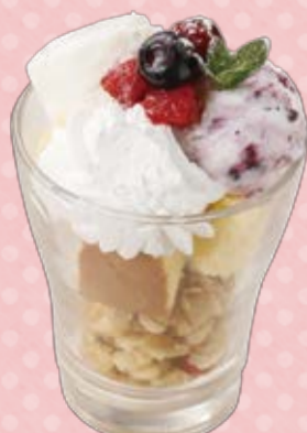
ミニチーズパフェ