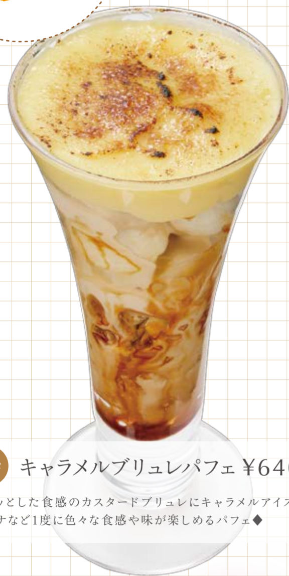
Parfait キャラメルブリュレパフェ ¥640

パリッとした食感のカスタードブリュレにキャラメルアイスやバナナなど1度に色々な食感や味が楽しめるパフェ◆