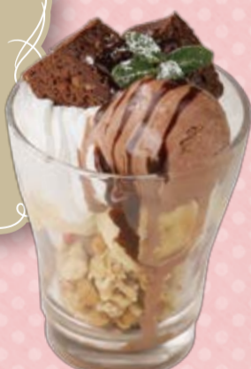
ミニチョコバナナパフェ