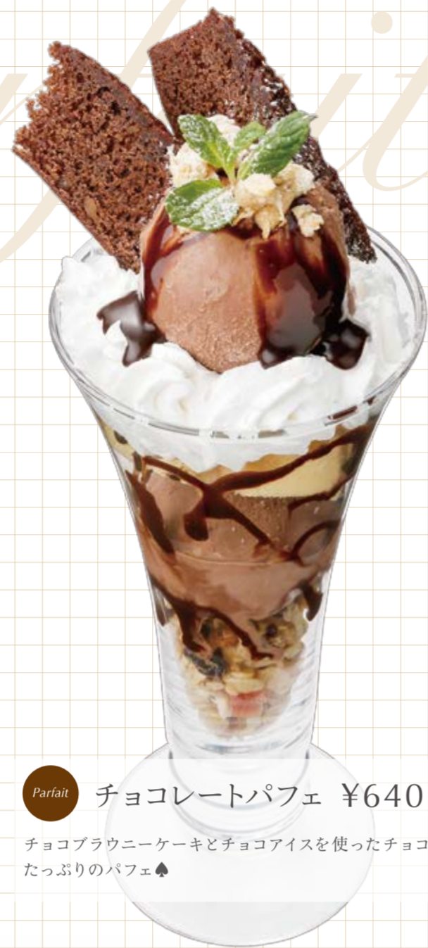
Parfait チョコレートパフェ ¥640

ブルーベリーチーズアイスにレアチーズケーキ。ホイップとベリーでかわいく仕上げました♥