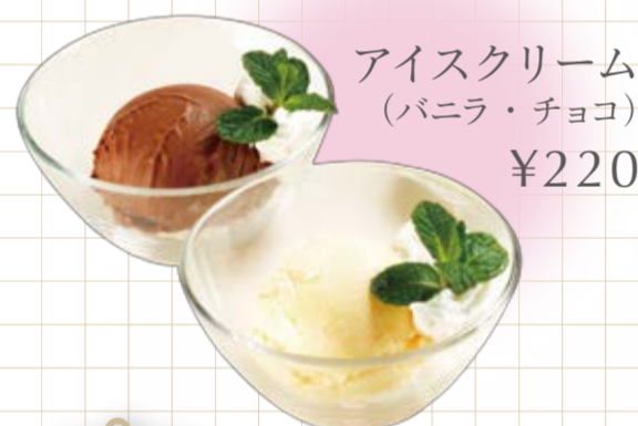
アイスクリーム (バニラ・チョコ) ¥220