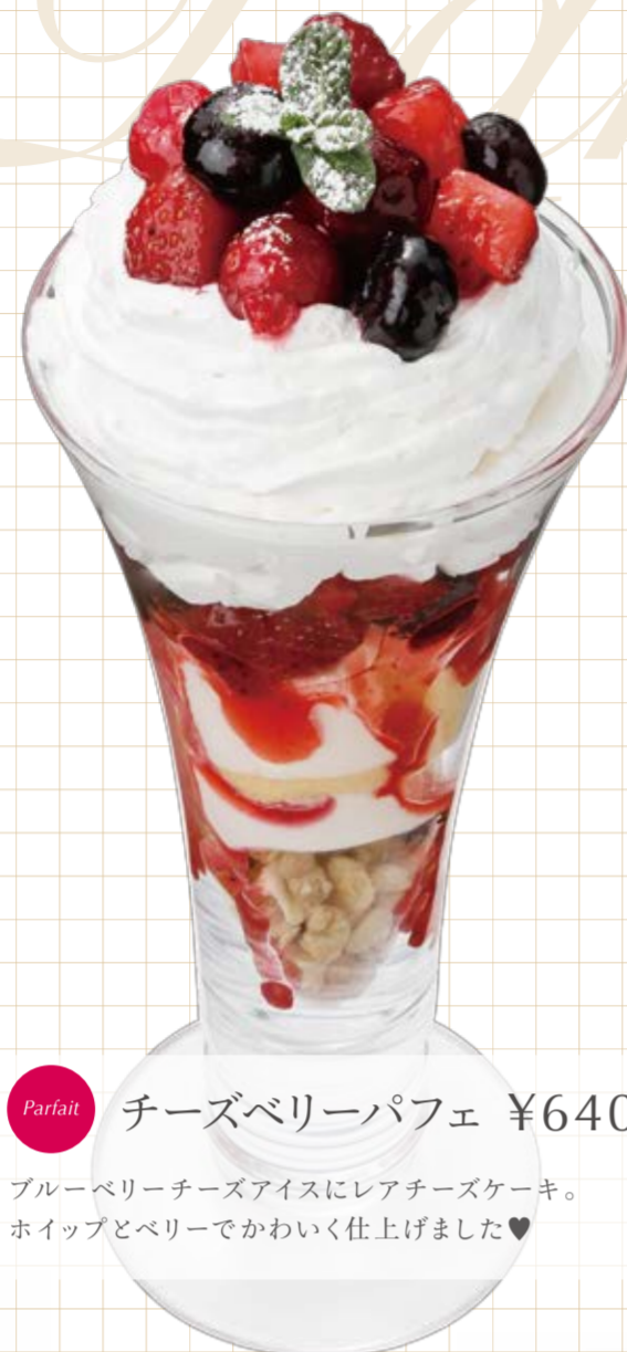
Parfait チーズベリーパフェ ¥640

パリッとした食感のカスタードブリュレにキャラメルアイスやバナナなど1度に色々な食感や味が楽しめるパフェ◆