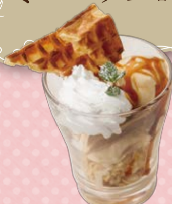
ミニキャラメルワッフルパフェ